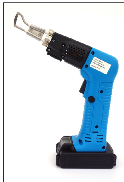
Accumulateur HSG-0 avec lame de coupe type R-Accu