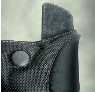
Courroies de transport