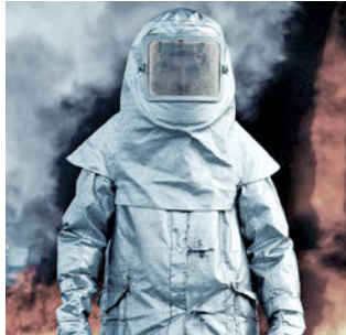
Vêtements de protection