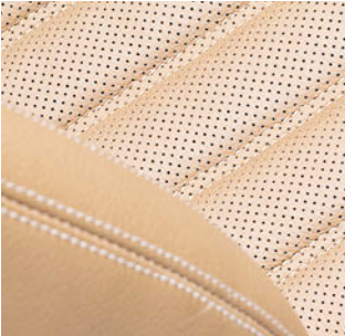
Sièges de voitures