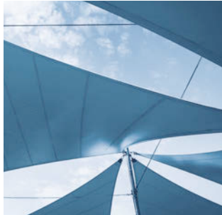
Systèmes de pare-soleil